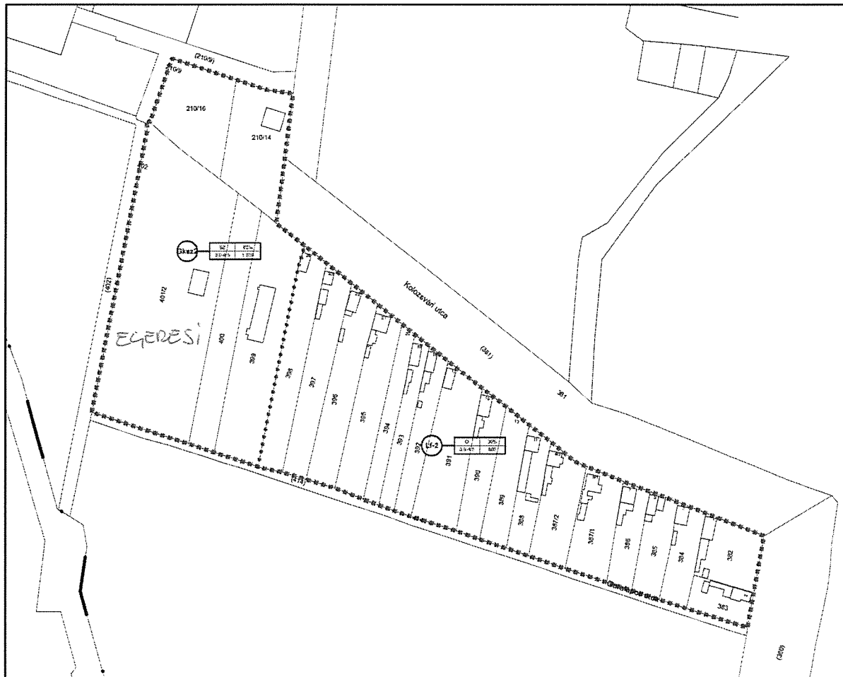
Kolozsvári utcai tömb (7. melléklet)