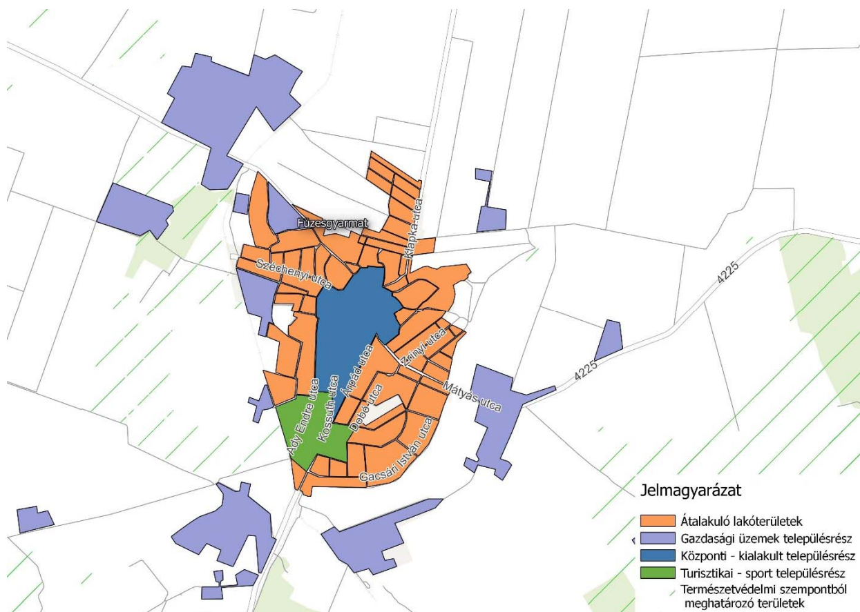
2. ábra: Településképi szempontból meghatározó területek a település belterületén