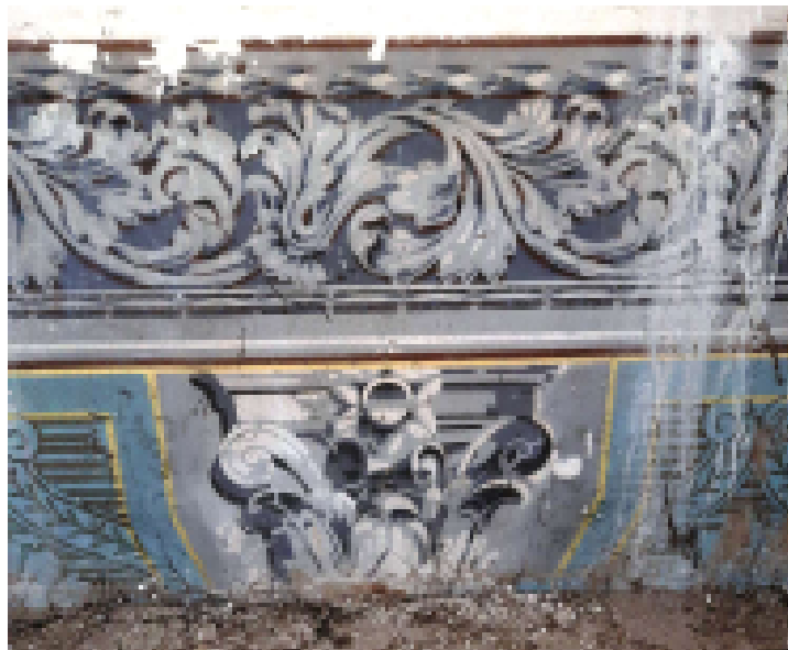
Részlet az egykori zsinagóga ma is meglévő, eredeti falfestéséből