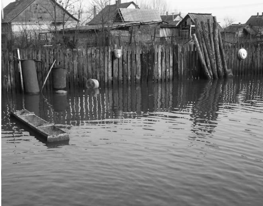
Komoly károkat okoz a belvíz Füzesgyarmaton is.

A Klapka úti ovisok lehetőséget kaptak december 7-én, hogy eljuthassanak a Fővárosi Nagycirkuszba a Grund Klub által szervezett „Mi van a puttyban?” című előadásra. 3. oldal