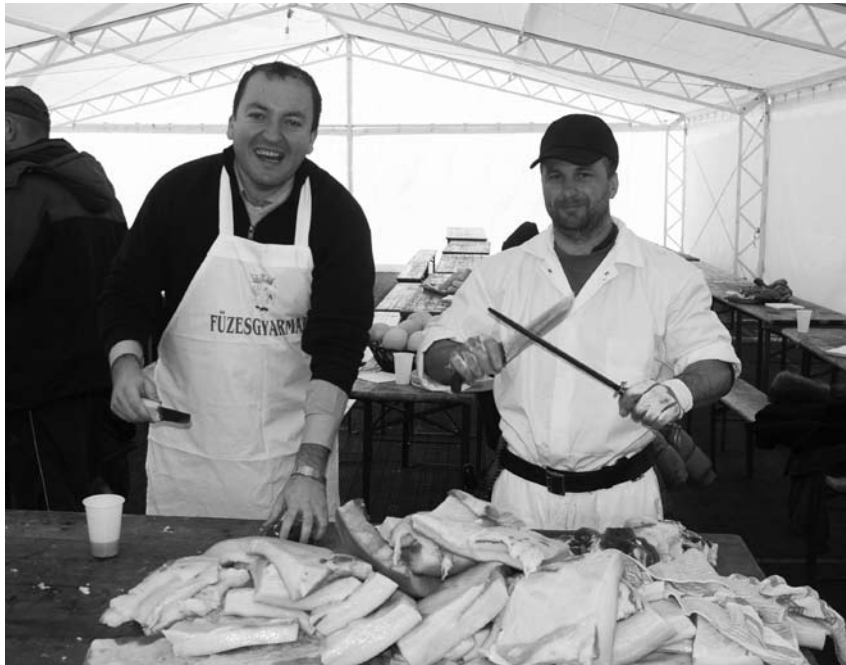
Készülnek a disznótoros finomságok a gyarmati Vadásznapon. 2. oldal

Januárban nyolc gyakornok kezdte meg három féléven keresztül tartó szakmai gyakorlatát a cégnél. 3. oldal